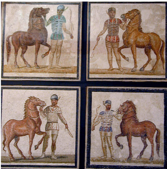
Picture 1 Four teams

Candidates should study the following pictures, one or more of which will be being used as a basis for questions in each question paper.