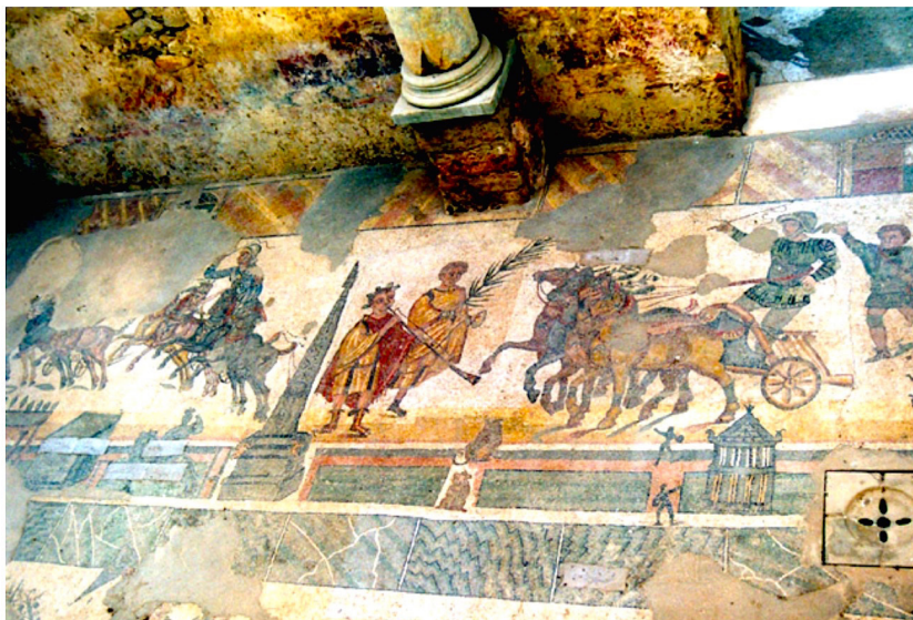
Picture 6 The winner