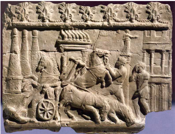
Picture 5 A crash