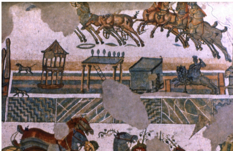
Picture 3 The spina