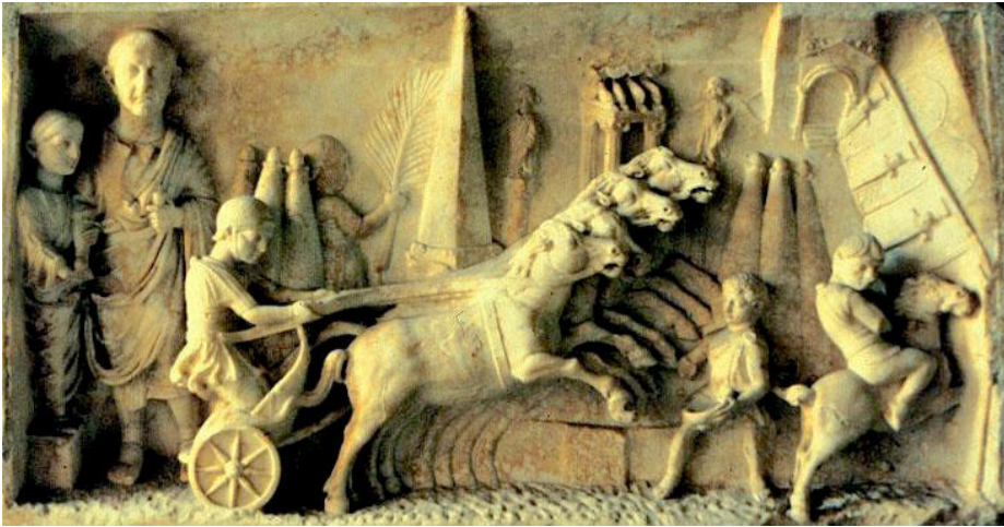
Picture 4 Preparing to turn at the meta