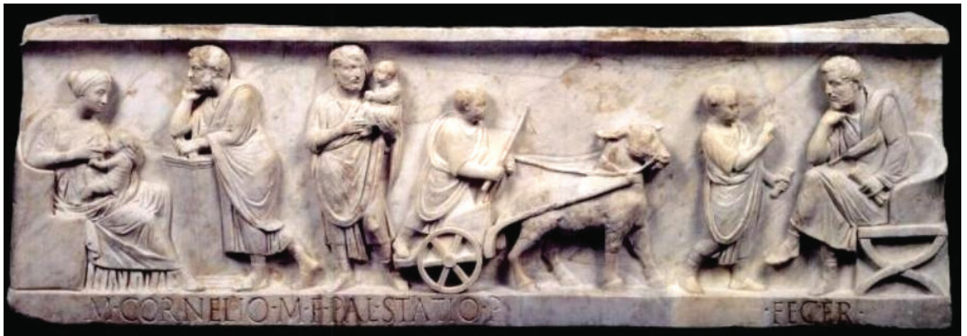
Picture 1 Stages in growing-up, illustrated on a sarcophagus

Candidates should study the following pictures, one or more of which will be used as a basis for questions in each question paper.