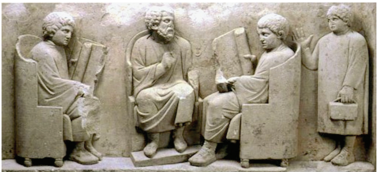
Picture 2 School scene