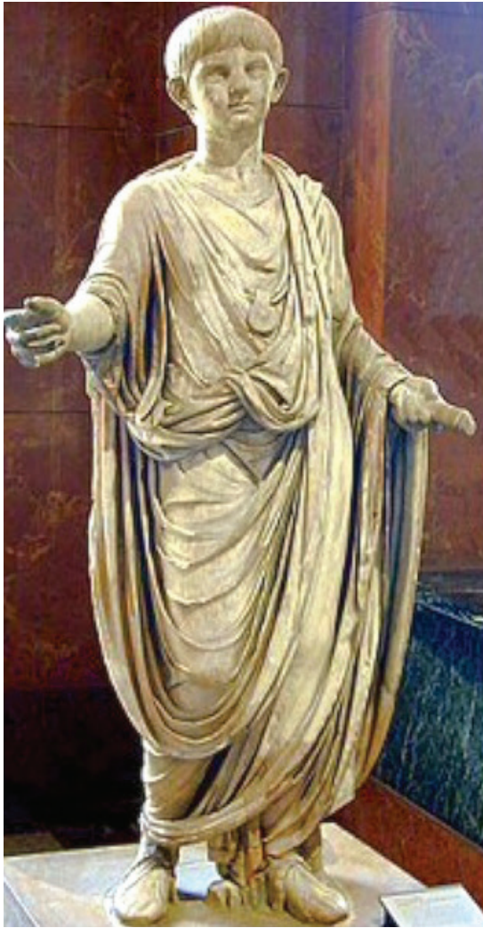
Picture 3 A boy orator